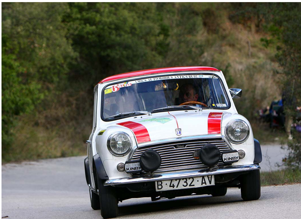
Saltó – Pinyol, guanyadors de la FEVA